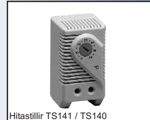
Hitastillir TS141 / TS140